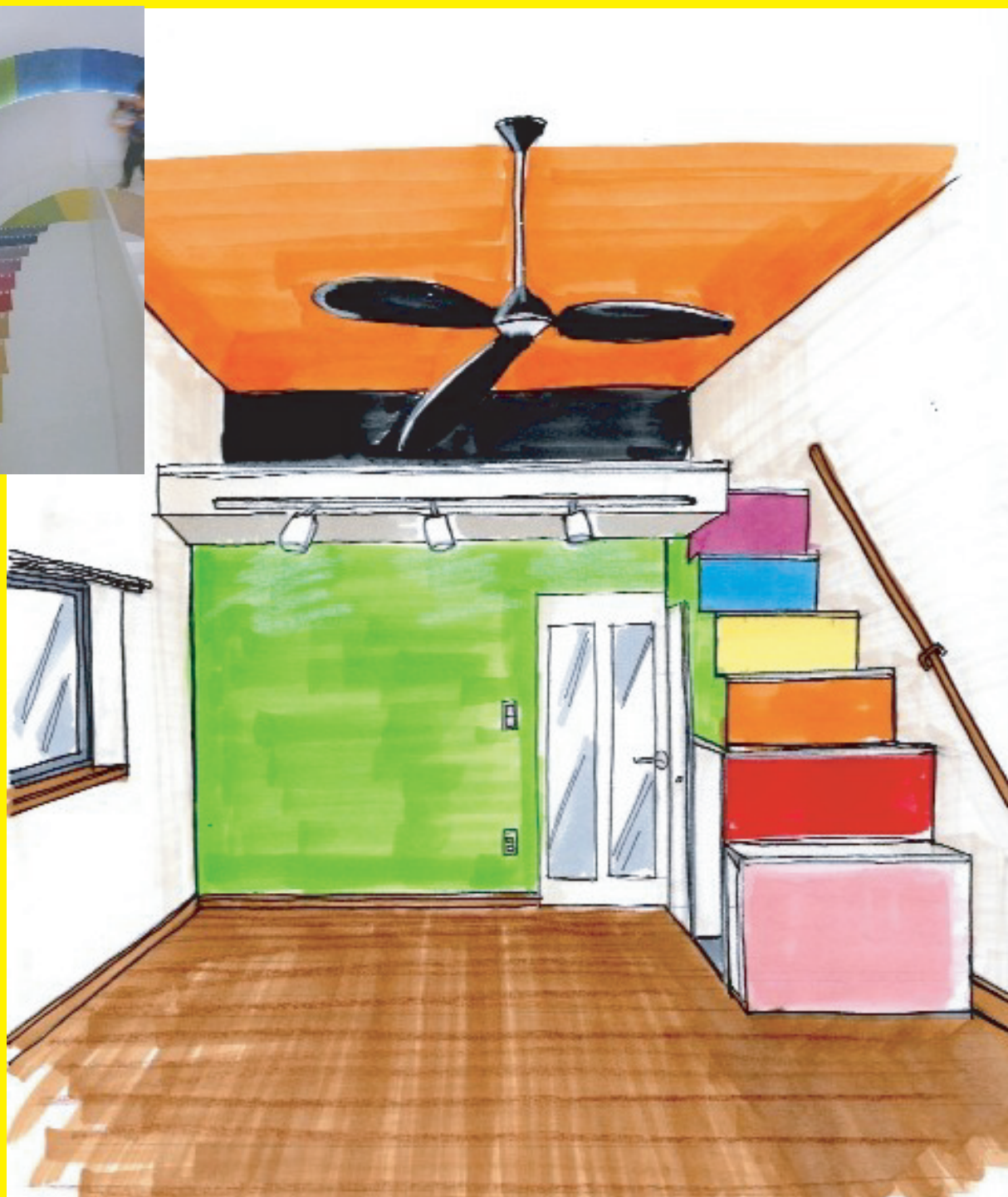
ロフト再生リノベイメージ